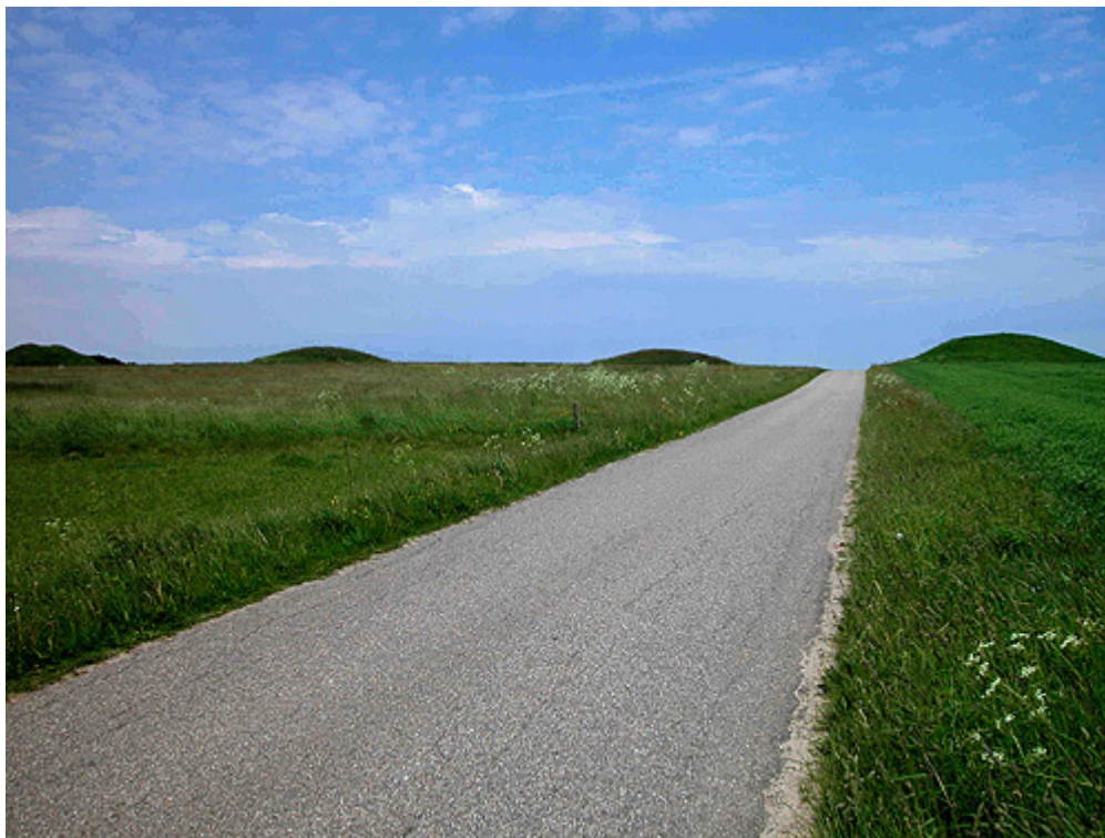
Fire af de bevarede høje set fra sydvest.

udhulede egekister. Siden hen blev nye grave tilføjet ved udvidelser af højen og omkring de gamle storhøje anlagdes også mindre høje, så stedet efterhånden blev til en gravplads.