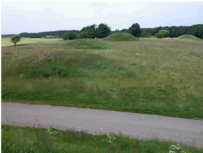
4: Bronzealderens gravhøje ligger samlet på gravpladser. Her de 3 høje nord for vejen.