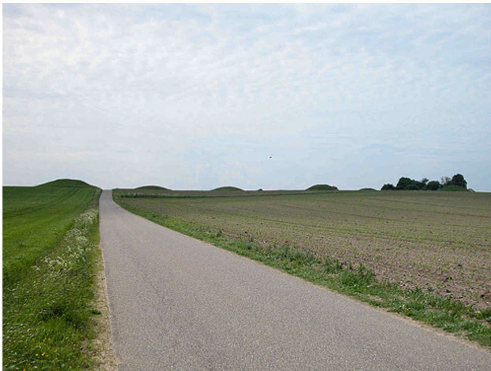
Vinding Ottehøje på bakketoppen 145 m.o.h. Her set fra nordøst.

De monumentale gravhøje ses viden om og kroner i flot silhuet bakkedraget 145 m over havets overflade. Ingen af de 6 bevarede høje har været undersøgt arkæologisk, men ud fra deres placering og størrelse dateres de til bronzealderen (1.800 - 500 f.Kr.).