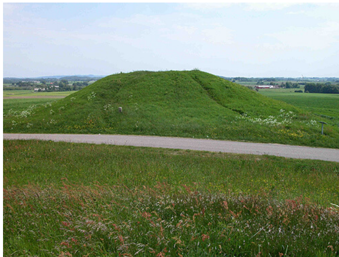
5: Den sydligste af Vinding Ottehøje - her set fra nord - hvorfra det omliggende landskab let overskues.