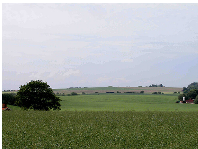
2: Højgruppen ses viden om. Her på ca 2,5 km afstand fra vejen syd for Addit.

Udsigt mod nordøst fra Vinding Ottehøje. Løndal, Velling og Addit Skov rummer også mange fine fortidsminder.