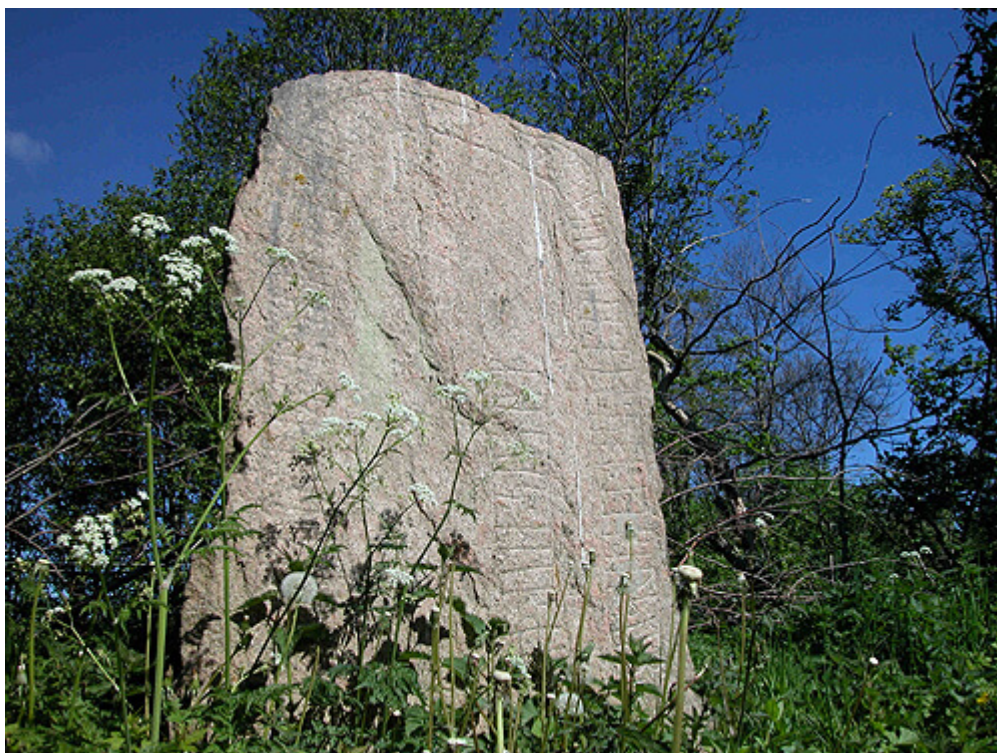
Nærbillede af runeteksten på toppen af Svenstrup-stenen.

Den lidt over 1,5 m. store runesten er i lysegrå og let rødlig granit, og på den plane flade mod vejen ses en indskrift i et bånd langs stenens kant og i et lodret bånd lidt til højre for midten af stenen. Runeskriften er i det såkaldte yngre futhark-alfabet med kun 16 tegn, som kompliceres af, at de enkelte tegn i alfabetet kan have flere forskellige betydninger.