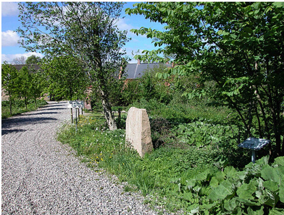
Runeteksten på forsiden af Svenstrup-stenen set fra syd.

Den lidt over 1,5 m. store runesten er i lysegrå og let rødlig granit, og på den plane flade mod vejen ses en indskrift i et bånd langs stenens kant og i et lodret bånd lidt til højre for midten af stenen. Runeskriften er i det såkaldte yngre futhark-alfabet med kun 16 tegn, som kompliceres af, at de enkelte tegn i alfabetet kan have flere forskellige betydninger.