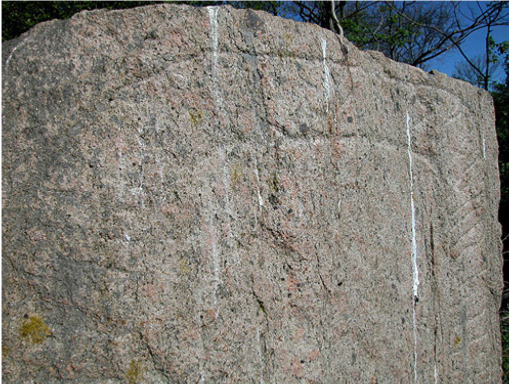
Udsigt mod nordvest over Kjellerup Sø fra Svenstrup-runestenen.

Sprogstilen og skriften daterer runeteksten til vikingetiden mellem år 950 og 1025.