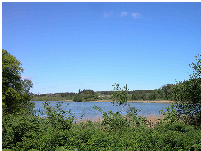
3: Udsigt mod nordvest over Kjellerup Sø fra Svenstrup-runestenen.