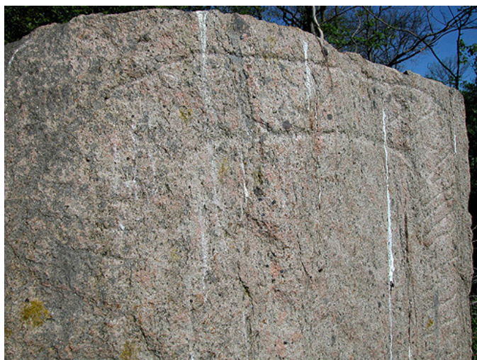
2: Nærbillede af runeteksten på toppen af Svenstrup-stenen.