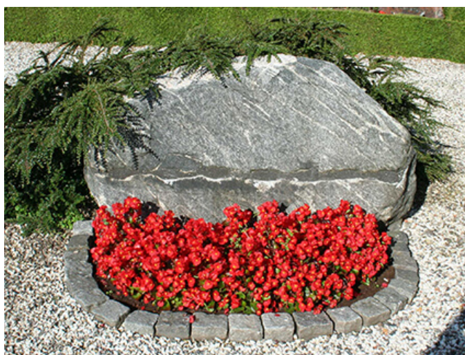
2: Runestenen var frem til 2015 opsat vandret, men er nu restureret og genopsat lodret som oprindelig i vikingetiden.