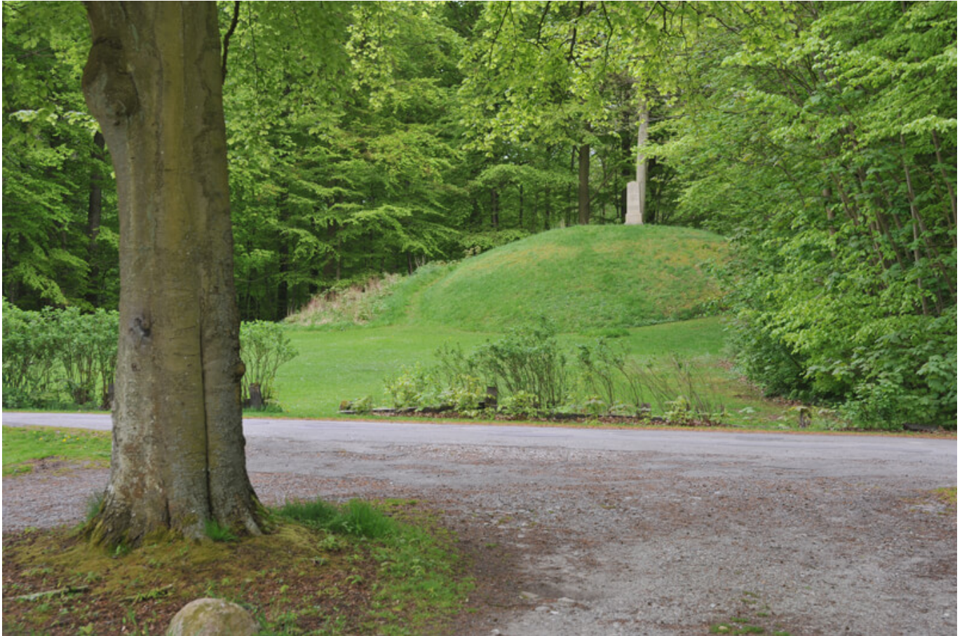
1: Den store gravhøj på festpladsen i Fanefjord Skov set fra vest.

I den kystnære Fanefjord Skov på det sydøstlige Møn ligger 16 fredede gravhøje af forskellig størrelse fra bronzealderen. Ingen af højene har været genstand for arkæologiske undersøgelser, så dateringen til bronzealderen (1.700 - 500 f. Kr.) baseres væsentligst på højenes størrelse og landskabelige placering.