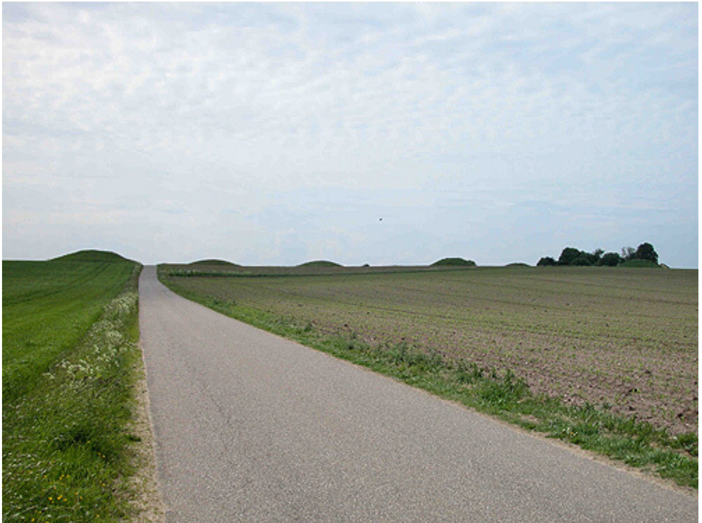
1: Vinding Ottehøje på bakketoppen 145 m.o.h. Her set fra nordøst.