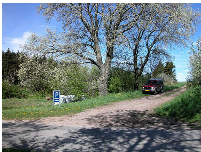
4: Markvejen fra Kongshøjvej som leder op til Thorsø Høje-gravpladsen.