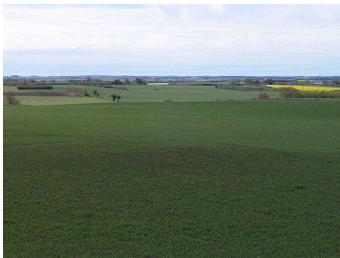
3: I markerne omkring højgruppen ses stadig adskillige overpløjede gravhøje. Her på marken vest for langhøjen "Melsækken".