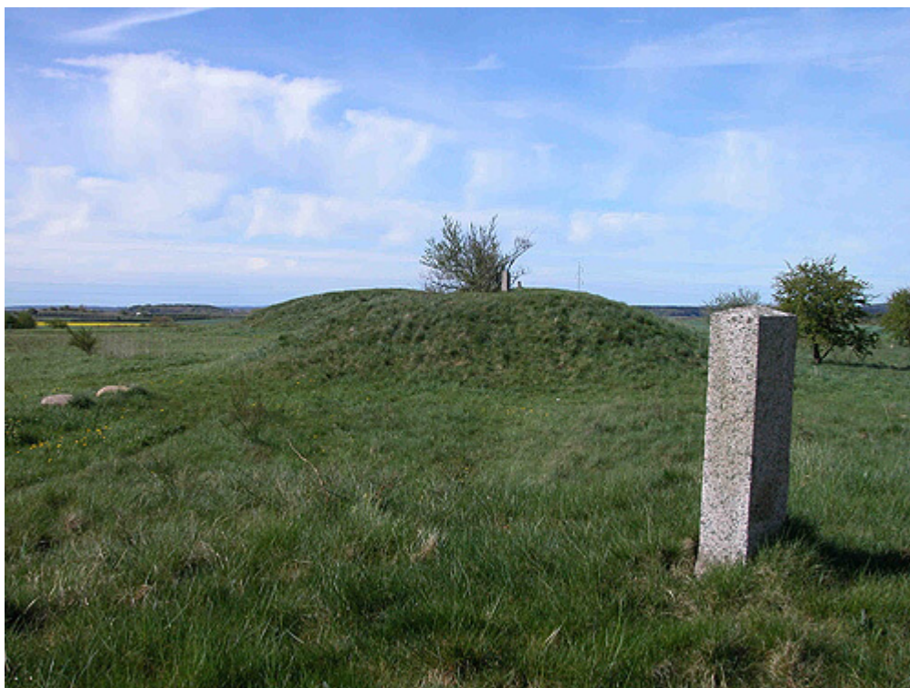
Fredningsstenene på højene blev opsat som led i højenes frivillige fredning før 1937.

I 1938 undersøgte Nationalmuseet den nu fjernede gravhøj "Melhøj" på marken ca. 250 m. mod vest. Ejeren havde tidligere under bortkørsel af jord fra højen stødt på 2 grave. Ved udgravningen fremkom yderligere 3 brandgrave fra tidlig yngre bronzealder, ca. 1.000 f.Kr. og som i de to første lå de brændte ben i næsten mandslange stenkister.