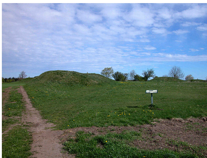
5: Thorsø Høje set fra syd. I forgrunden til venstre ses langhøjen "Melsækken".