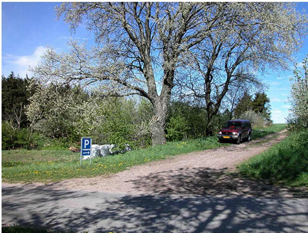
Markvejen fra Kongshøjvej som leder op til Thorsø Høje-gravpladsen.

"Melsækken" er en langhøj, som sikkert rummer adskillige begravelser tilføjet over længere tid. Blandt de omgivende rundhøje er den måske den ældste høj, da sådanne langhøje typisk tilhører bondestenalderen. De øvrige rundhøje stammer ud fra deres størrelse, form og høje landskabelige beliggenhed at dømme primært fra den efterfølgende bronzealder (1.800 - 500 f.Kr.).