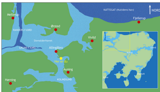
Kort over den vestlige del af Kolindsund i oldtiden.