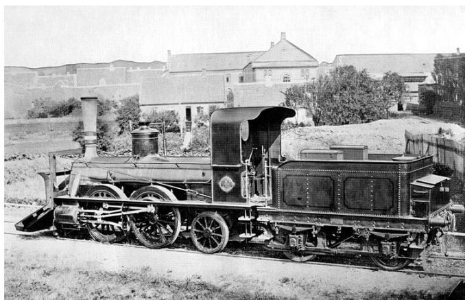
En af de 7 tyske Hanomag-lokomotiver som kørte på Østjyske Jernbane. Her ved "Strømmen" i Randers i 1877.

I dag passerer en 4 kilometer lang asfalteret gang- og cykelsti lige forbi gravhøjene. Stien ligger på den gamle jernbanedæmning i sundet fra Allingåbro - Auning jernbanen, som blev anlagt som privatbane af "Østjydske Jernbane" i 1876. Jernbanen, som allerede i 1881 blev overtaget af staten grundet dårlig økonomi, havde udgangspunkt i Randers og fortsatte til Ryomgård. Fra Ryomgård stod banen i forbindelse med Århus - Grenå banen, som endvidere fra 1901 havde forbindelse fra Trustrup til Ebeltoft og til Gjerrild i 1911. Jernbanen fungerede som person- og varetransport - herunder som forbindelse til havnene i såvel Grenå og Randers. I Randers var banen også i forbindelse med den østjyske længdebane, hvoraf Århus-Randers banen blev anlagt som den første del i 1862. Randers-Ryomgård banen var i brug indtil 1971 og som godsbane indtil 1993. Se mere herom på Djurslands Jernbanemuseum i Ryomgård.