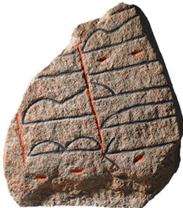
4: Optegning af Langåstenen IV, som kan ses på Muesum Østjylland i Randers.