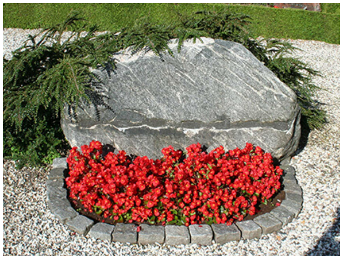
2: Runestenen var frem til 2015 opsat vandret, men er nu restureret og genopsat lodret som oprindelig i vikingetiden.