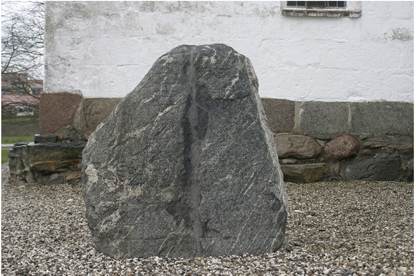
Langåstenen III efter restaurering og genrejsning 2015.