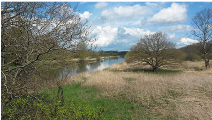
3: Parti fra Gudenåen ved Langå, tæt på runestenens fundsted.