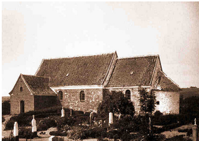
Krogsbæk Kirke før nedrivningen i 1901. Her set fra sydøst. Gravene på kirkegården ligger der stadig, men alle gravsten er nu forsvundet.