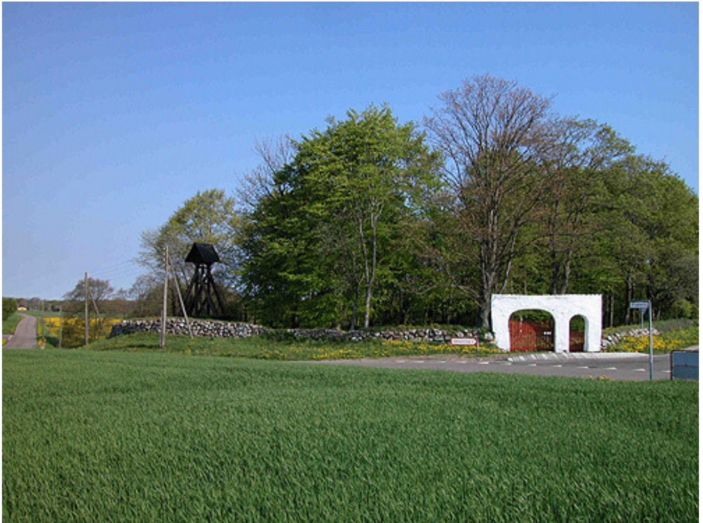
Krogsbæk Ødekirke i nordvest-hjørnet af Krogsbæk sogn som stedet ser ud i dag. Her set fra syd.