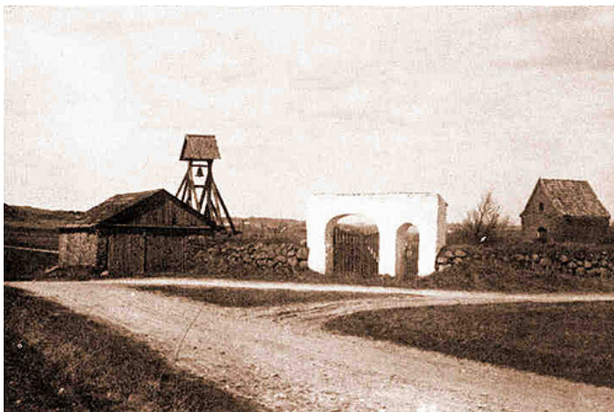
Krogsbæk Kirke før nedrivningen i 1901. Her fra sydøst med den tidligere lade i stendiget.

En gang om året - den sidste torsdag i Juli - kalder klokken til friluftsgudstjeneste på stedet, og der opsættes da et simpelt kors på tomten af den gamle kirke. Til dagligt samles menigheden i Karlby Kirke, som blev indviet d. 6/7 1902. Sokkelstenene, døbefonten, prædikestolen og alterskranken fra den nedbrudte kirke ved Krogsbæk blev genanvendt heri og lever således også videre.