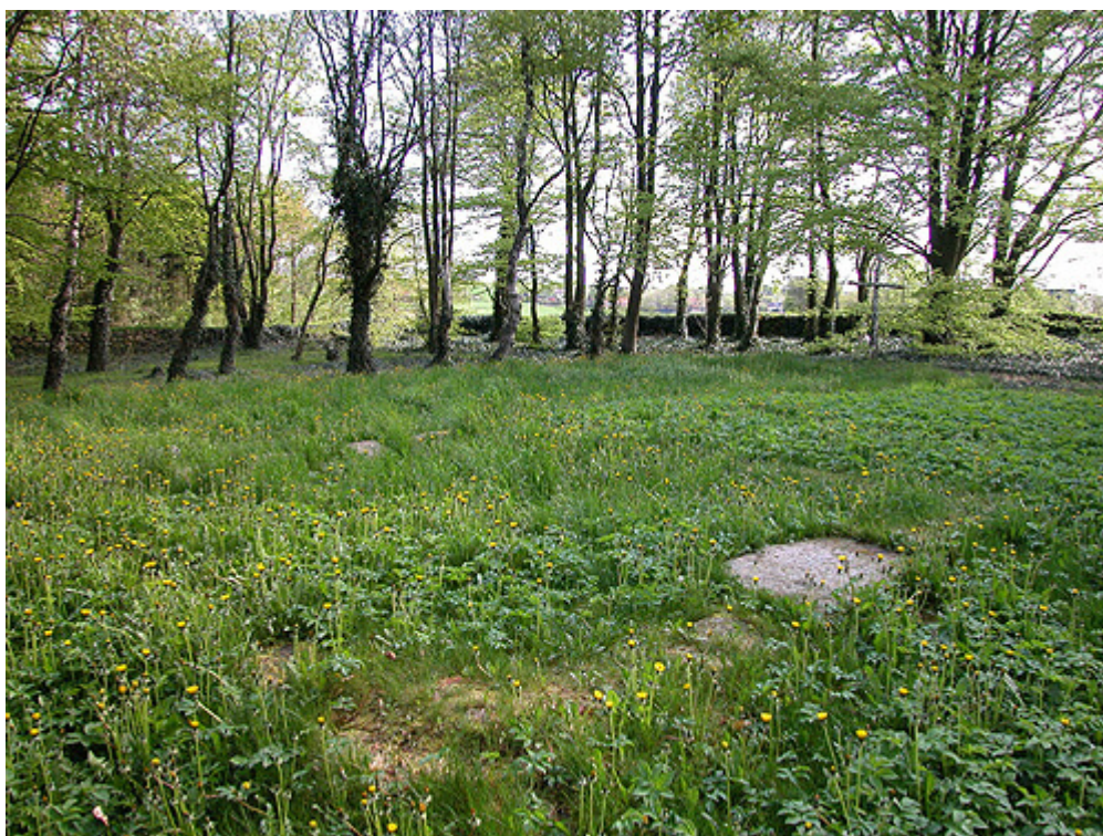
Kirketomtten i dag. Her set fra sydvest med fundamentsten fra kirkens våbenhus i forgrunden.

Krogsbæk Kirke var en beskeden kvaderstensopbygget romansk sognekirke med tegltag, formodentlig grundlagt engang i 1100-tallet. Koret var opbygget i tilhuggede kvadersten og kirkens rundbuede apsis mod øst var bygget i utildannede, kalkede marksten.