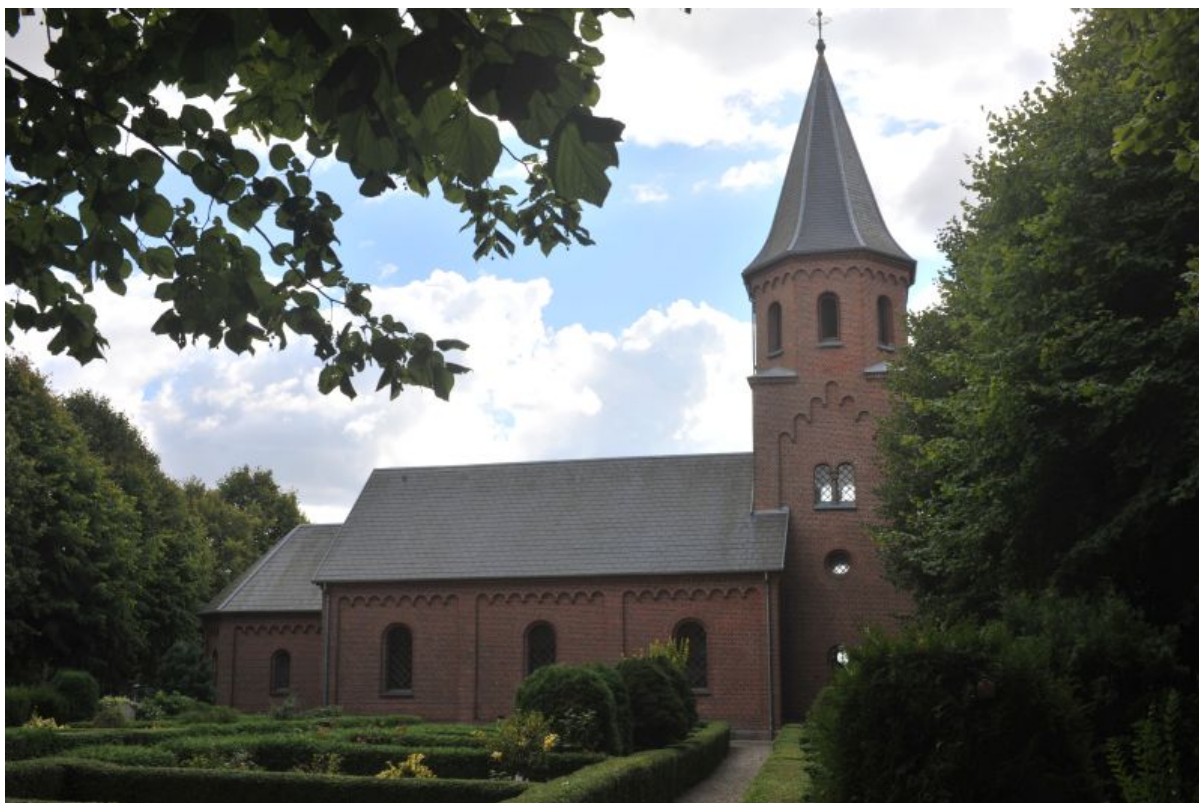
Grensten runestenen.

Den komplette og velproportionerede runetekst på Grensten-runestenen siger oversat til old- og nudansk: