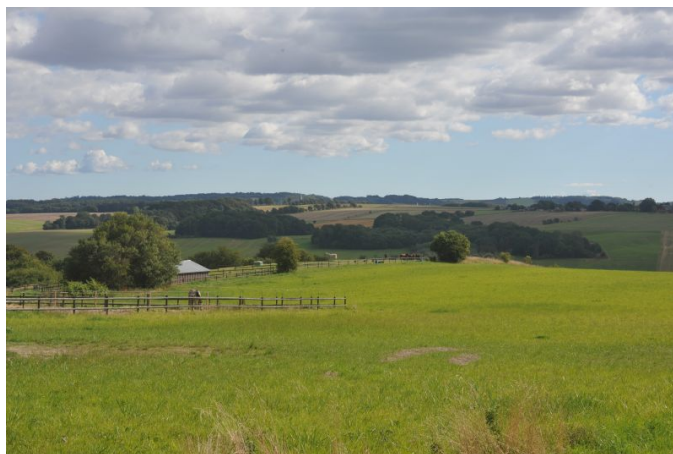
Fra kirken er det en flot udsigt over Gudenå-dalen.