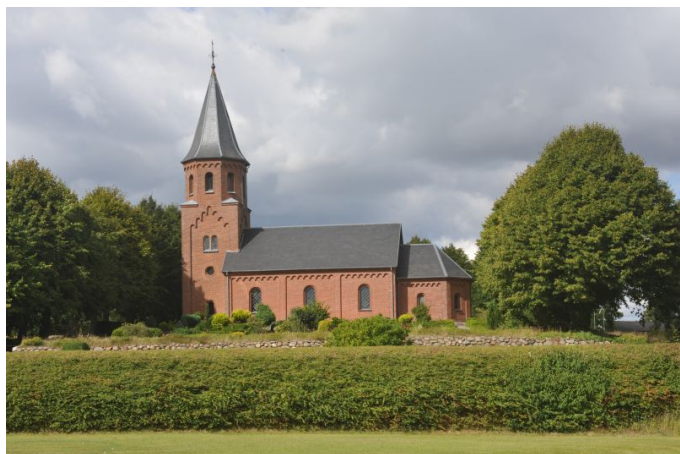
Den tidligere kirke var en romansk granitkvaderkirke, der bestod af kor, skib, våbenhus mod syd. Her nutidens kirke set fra ysd.

https://www.youtube.com/embed/vGZhHzDwNj8