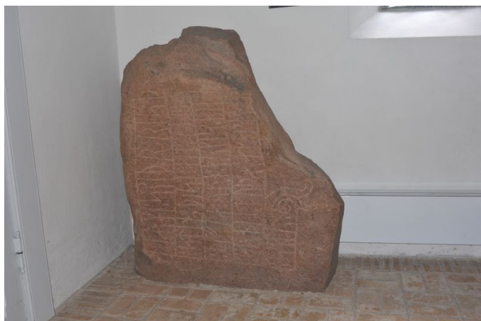
Runestenen i kirkens våbenhus.