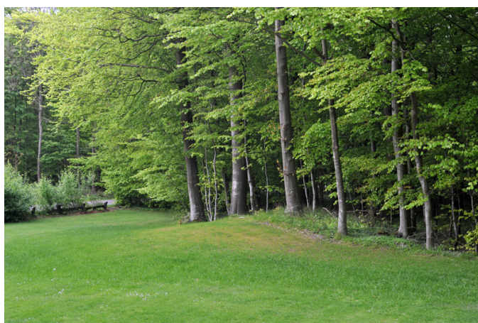
5: At højen er lille skyldes nok væsentligst at den er opført over brandgrave fra yngre bronzealder.