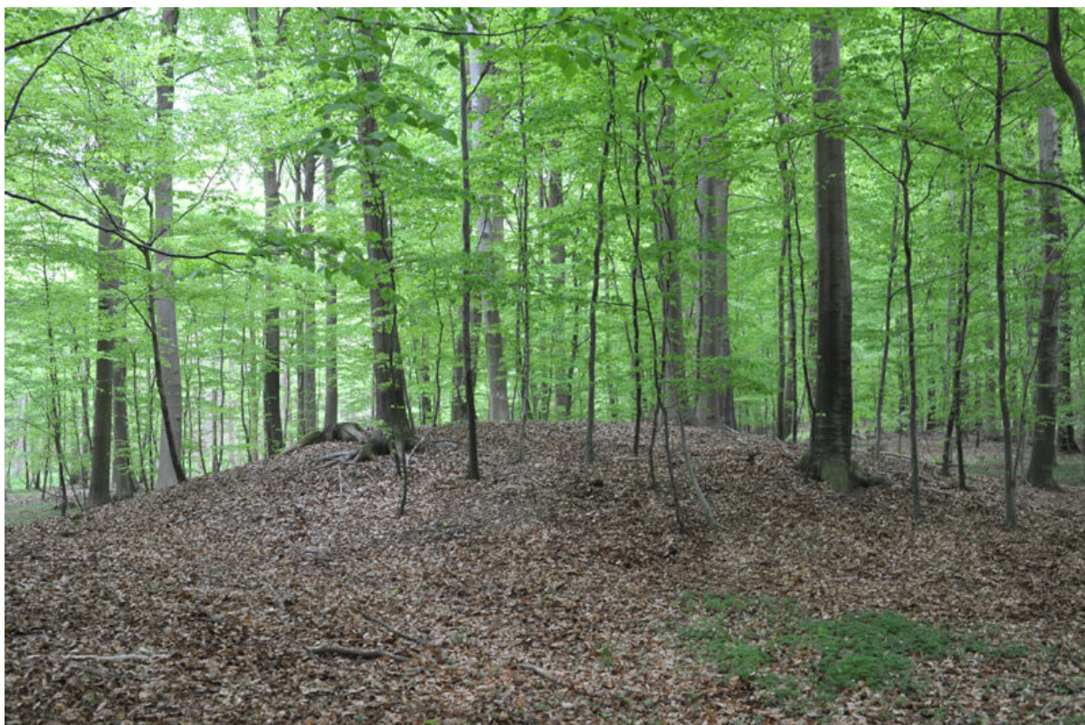
11: Her en typisk bronzealderhøj fra skoven.