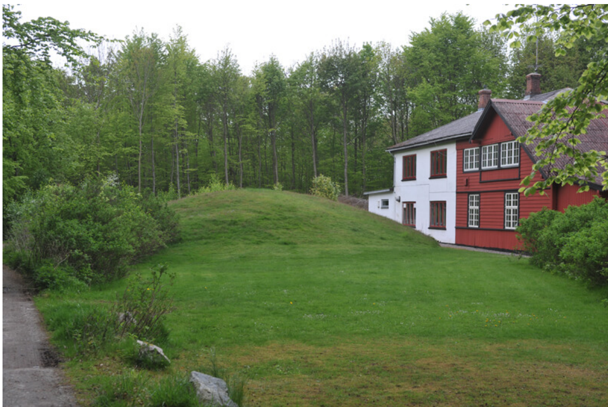
8: Flere gamle gravhøje ligger helt ind til Skovpavillionen.