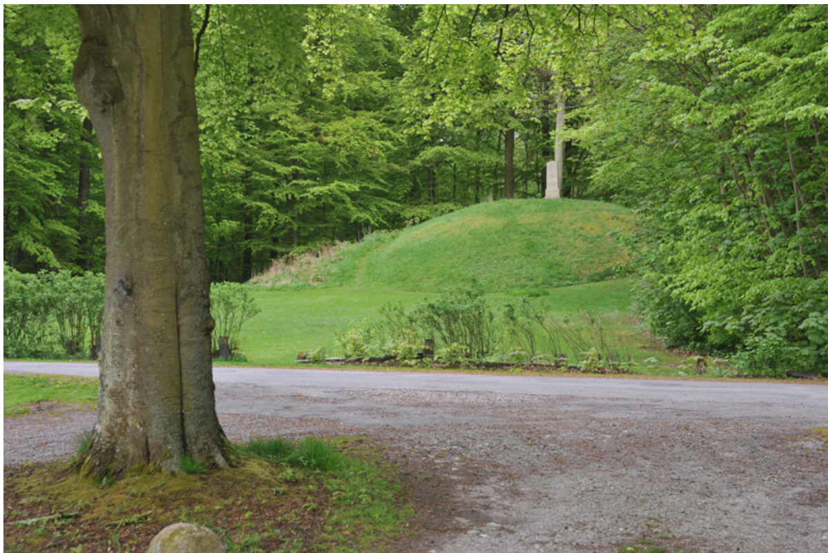
1: Den store gravhøj på festpladsen i Fanefjord Skov set fra vest.

Omkring fest- og samlingspladsen i skovens nordende, hvor du også finder "Skovpavillionen", ligger 6 lettilgængelige og seværdige gravhøje, hvoraf særligt den store høj i østsiden af arealet udmærker sig. Her er der også opsat en ny informationstavle, som fortæller mere om både gravhøjene og skovens historie.