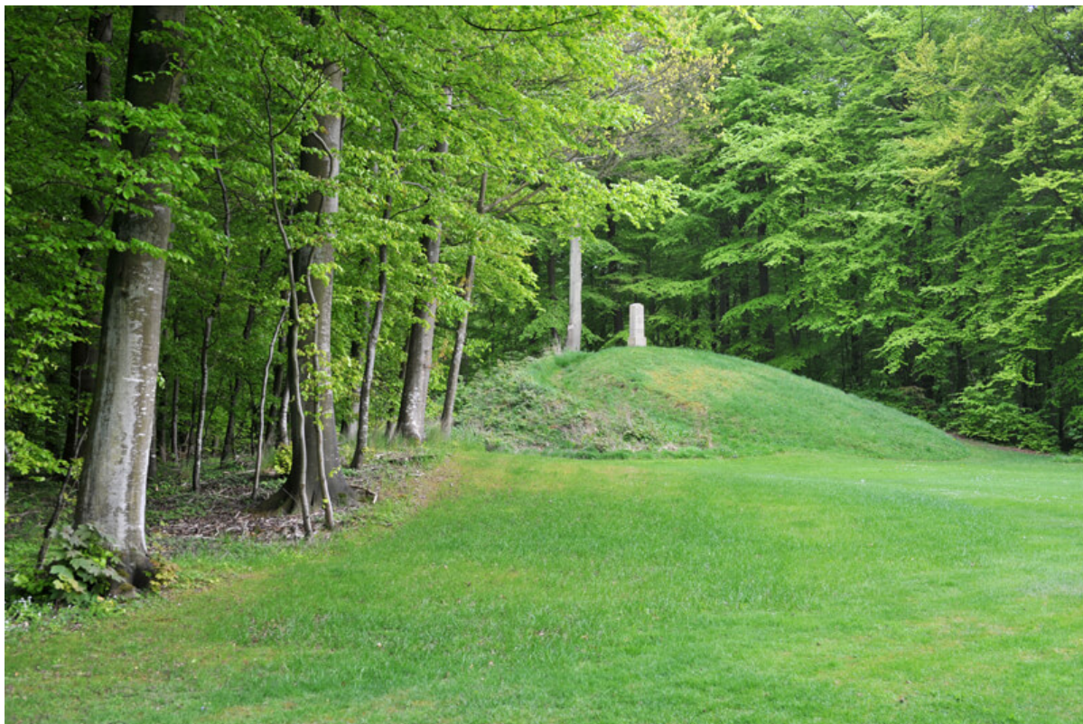
4: En lille og sikkert afgravet høj ses i skovskellet foran den store høj.

Den store gravhøj med mindestenen øst for skovpavillionen er den største af de tilbageværende høje i skoven. Højen må formodes anlagt i begyndelsen af bronzealderen og rummer sikkert adskillige gravanlæg og muligvis også flere byggefaser. I skovbrynet lige syd for højen ses en tilstødende meget lavere høj, som sikkert er yngre. Den repræsenterer sikkert en høj rejst direkte over urne- eller brandgrave, som fra midten af bronzealderen blev den helt dominerende gravform i modsætning til de ældre bronzealders ligbegravelser i udhulede egekister - de såkaldte bulkister.