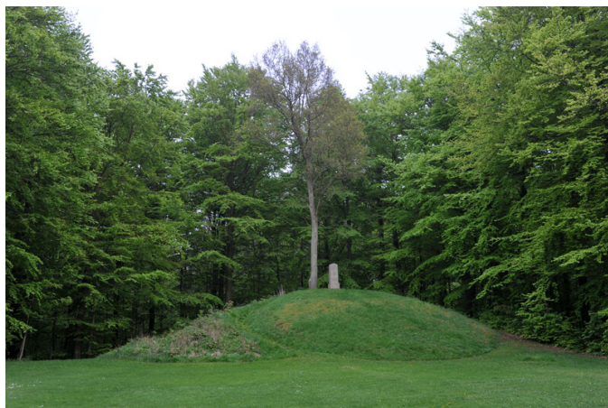
3: Da gravhøjen blev opført i bronzealderen var området nærmere et overdrevslandskab.