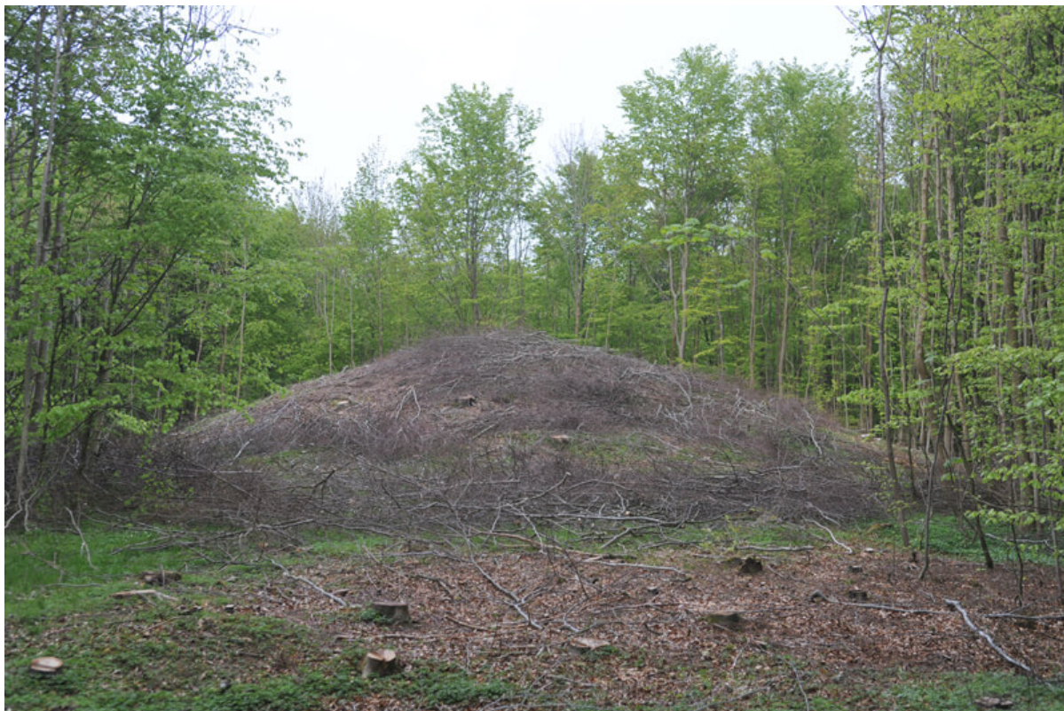
10: "Mortenshøj" er også en stor høj i skoven syd for Samlingspladsen.