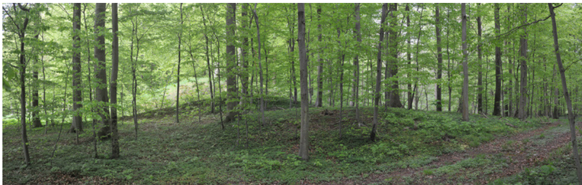
12: Panorama over småhøje i skoven lige syd for den store gravhøj på Samlingspladsen.