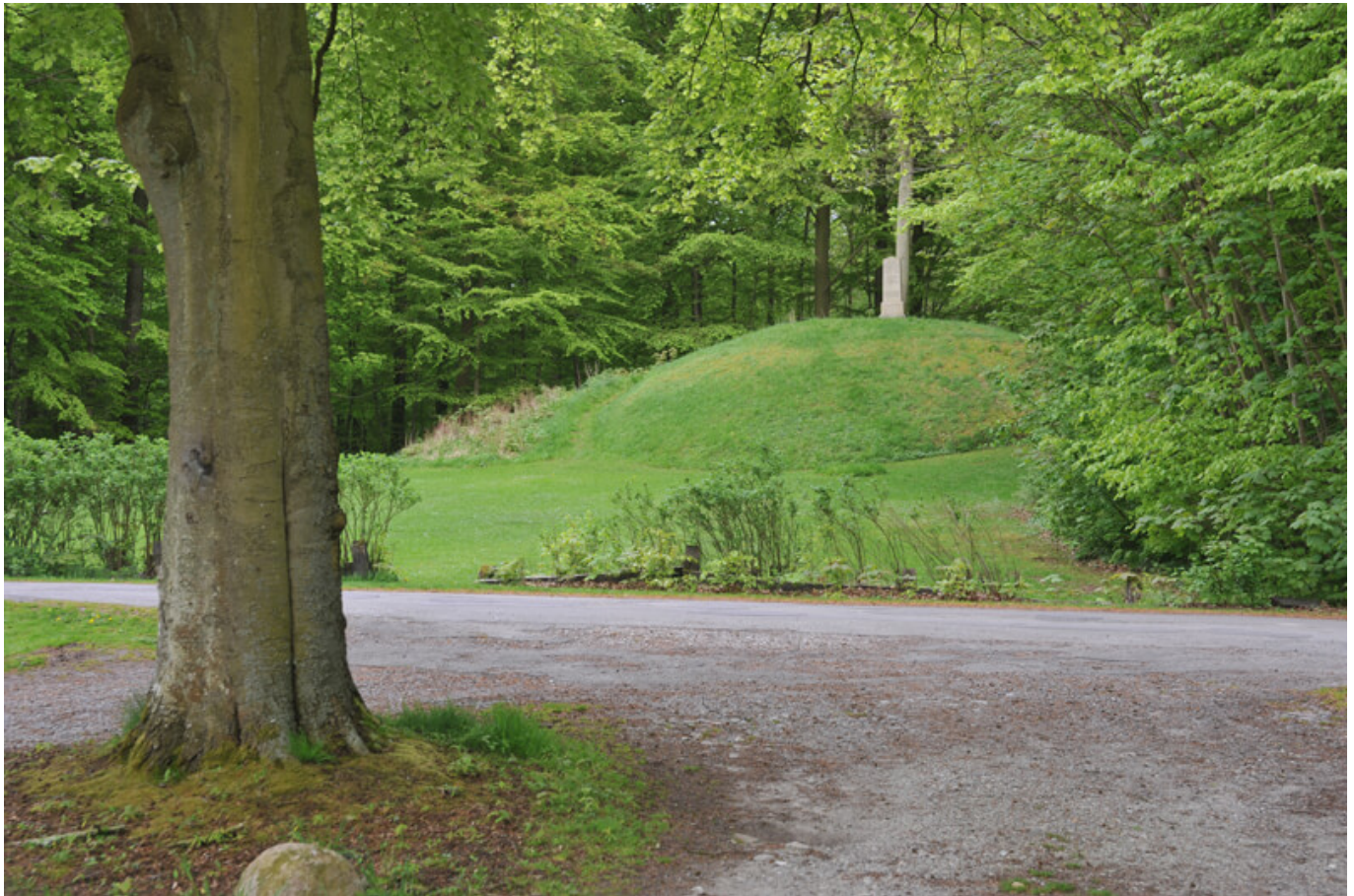
1: Den store gravhøj på festpladsen i Fanefjord Skov set fra vest.

I den kystnære Fanefjord Skov på det sydøstlige Møn ligger 16 fredede gravhøje af forskellig størrelse fra bronzealderen. Ingen af højene har været genstand for arkæologiske undersøgelser, så dateringen til bronzealderen (1.700 - 500 f. Kr.) baseres væsentligst på højenes størrelse og landskabelige placering.