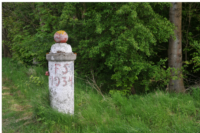
2: Ved indgangen til skoven står gamle markeringssten.