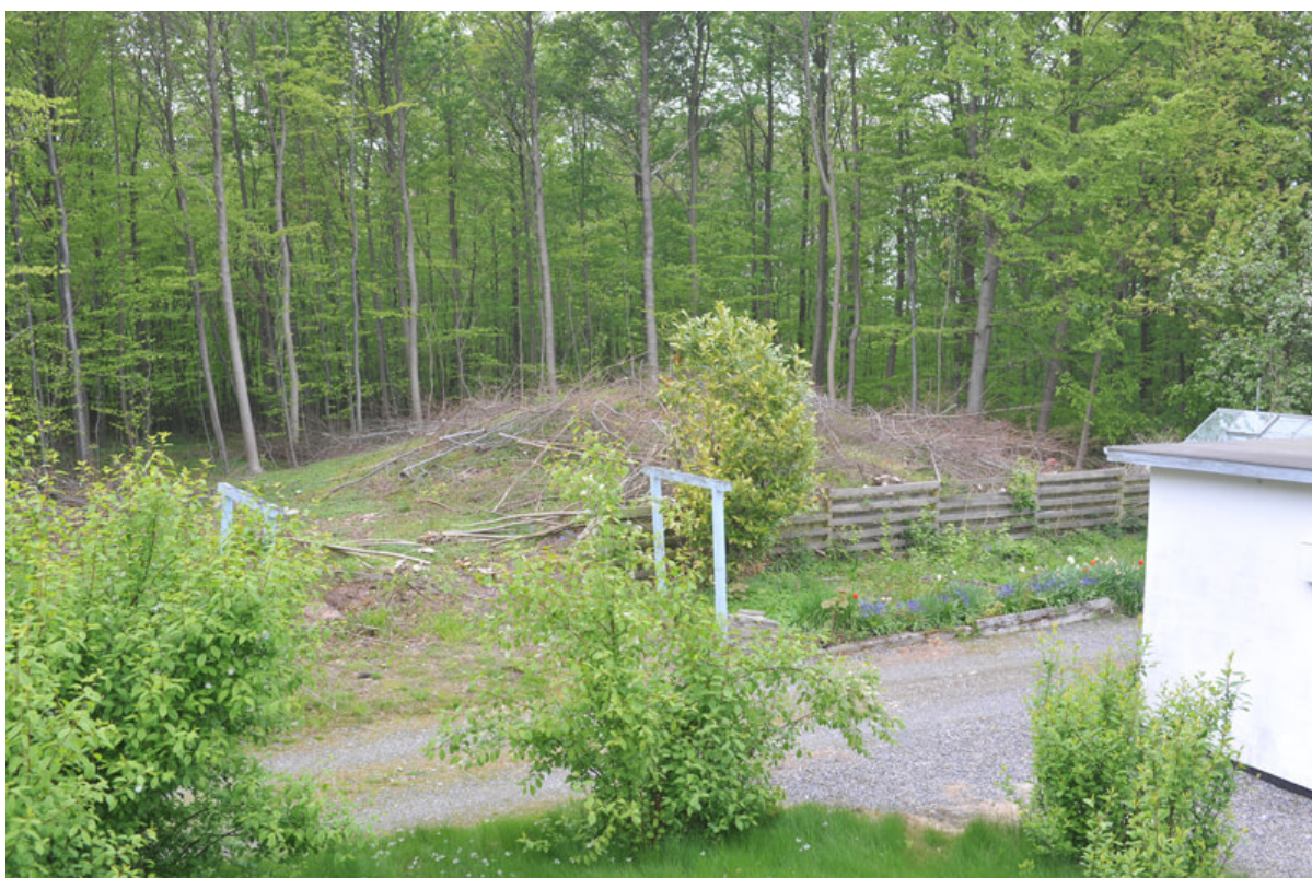
9: I 2012 er flere af højene omkring Samlingspladsen og rundt i skoven blevet frilagte, så de igen kan opleves i landskabet.