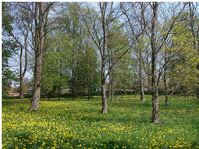
Under græsset ligger de gamle gravsteder stadig.

Gå på opdagelse i Assentoft Bakker - Se PDF-artikel - Klik her.