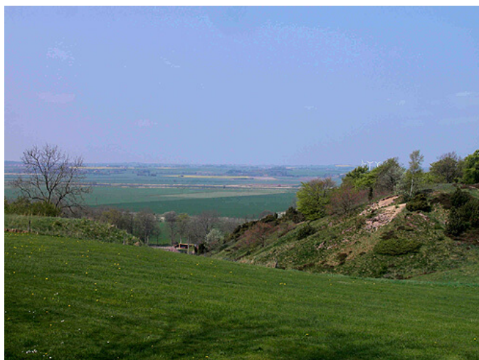
Udsigt over Randers Fjord- området lige nord for Essenbæk Kirke. Essenbæk Kloster lå fra 1180 nedenfor skrænterne.