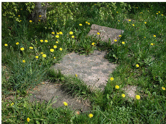
Gammel gravsted på den sydøstlige del af kirkegården.