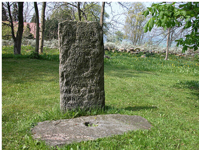
I nordvest-hjørnet står en mindesten over kirkestedet.