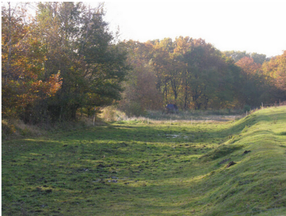
Christian d. III. Kanal ved Fladbro hvor profilet af middelalderens vandkanal stadig ses tydeligt. Her set fra øst mod Fladbro Skov.

Den 5,4 km. lange kanal som i 1553 blev anlagt fra Nørreåen ved Fladbro og til den vestlige udkant af middelalderens Randers repræsenterer et kæmpemæssigt anlægsarbejde. Kanalen forsynede voldgravene omkring middelalderbyen og Dronningborg Slot (opført 1547-50 på fundamentet af Gråbrødrekloster) med vand og tilførte også vand til Slotsmøllen lige udenfor Østerport - hvor Slotsgade i dag møder Østervold. Hvidemølle - Slotsmøllens afløser på grunden af det senere hospital i Randers ved Vestervold - blev også fra opførelsen 1642 forsynet med vand via kanalen, men da var byens voldgrave for størstedelen opgivet som forsvarsværk og afvandingen fra møllen forgik derfor ad en ny kanal mod syd til Gudenåen.