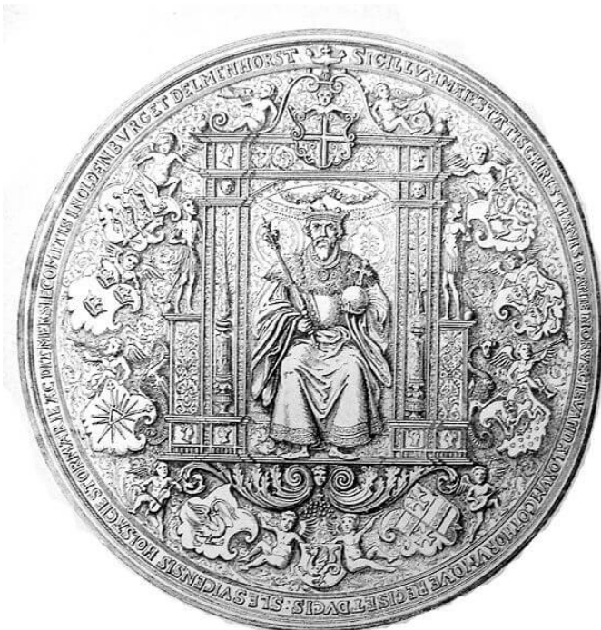
Chr. d.3. segl. Under Chr. d.3. blev Danmark igen samlet i et rige og i 1536 gennemførte han reformationen i Danmark. Billede fra Wikipedia.