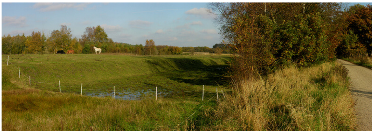
Kanalen ved Fladbro - set fra nordvest. Det 300 m. lange kanal-stykke fortsætter ind i skoven mod vest.

I østkanten af Fladbro skov ses kanalens profil stadig tydeligt i idylliske omgivelser over en næsten 300 meter lang strækning som mod vest fortøner sig ind i Fladbro Skov og mod øst (ind mod Randers) gradvist opløses af senere tids opdyrkning.