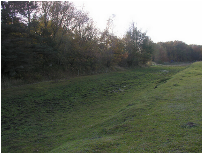
Der er bevaret to stykker af kanel: Ved Fladbro og ved Hornbæk Kirke.