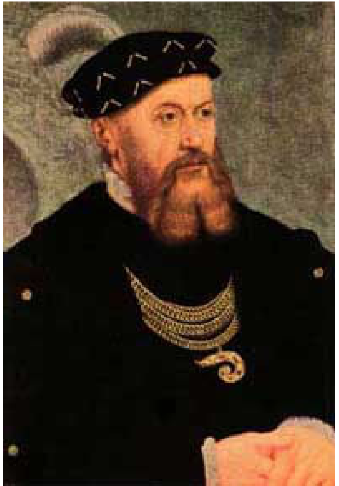
Kong Chr d. III. - Danmarks konge 1534-59.