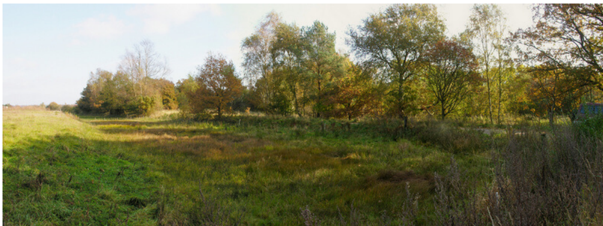
Chr. d. III. kanal ved Hornbæk set fra sydvest. I dag omgivet af bymæssig bebyggelse.

Det andet fredede kanal-stykke ligger nedenfor Hornbæk Kirke. Her ses et græsklædt og noget sammensunkenet, ca. 100 meter langt profil af kanalen, som i dag mod nord er helt omgivet af bymæssig bebyggelse. Mod syd er den fantastiske udsigt over Gudenådalens og de kæmpemæssige enge dog heldigvis stadig intakt.