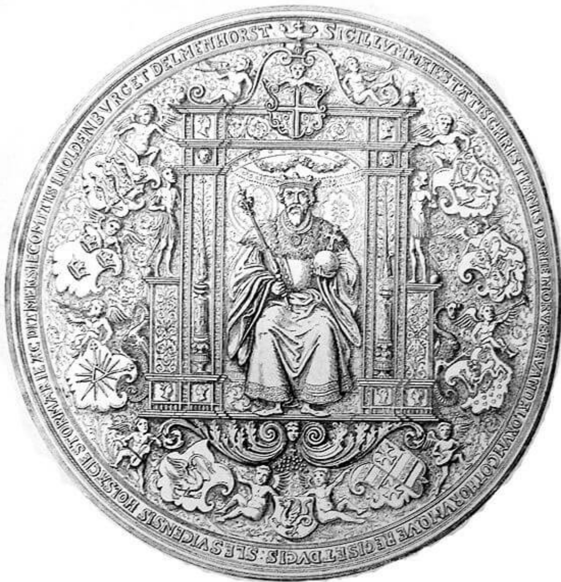
Kong Chr d. III. - Danmarks konge 1534-59.

Det kæmpemæssige anlægsarbejde blev udført som hoveriarbejde af områdets bønder og på gamle prospekter ses den færdige kanal tydeligt.