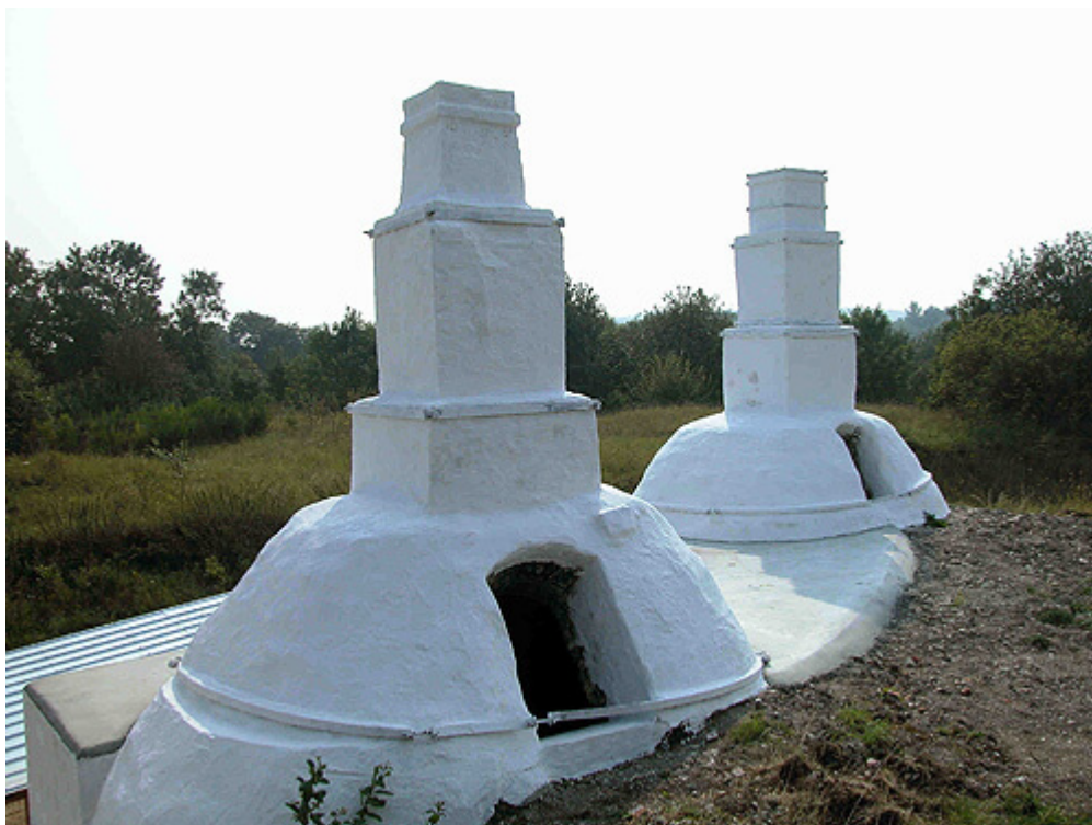
Kalkovnene er bygget ind i skrænten for lettere at kunne fylde dem.