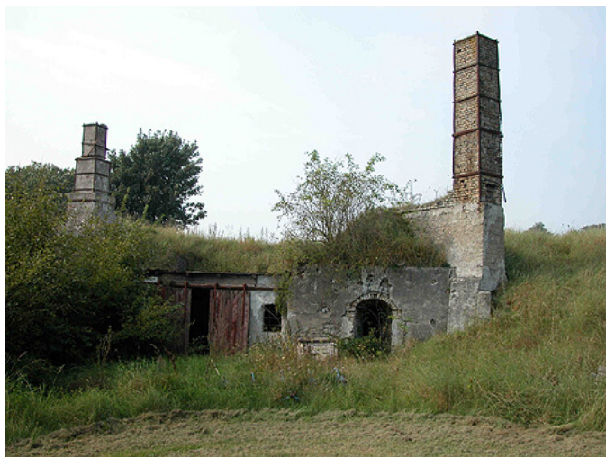
3: Området præges stadig af adskillige gamle kalkgrave og -ovne.