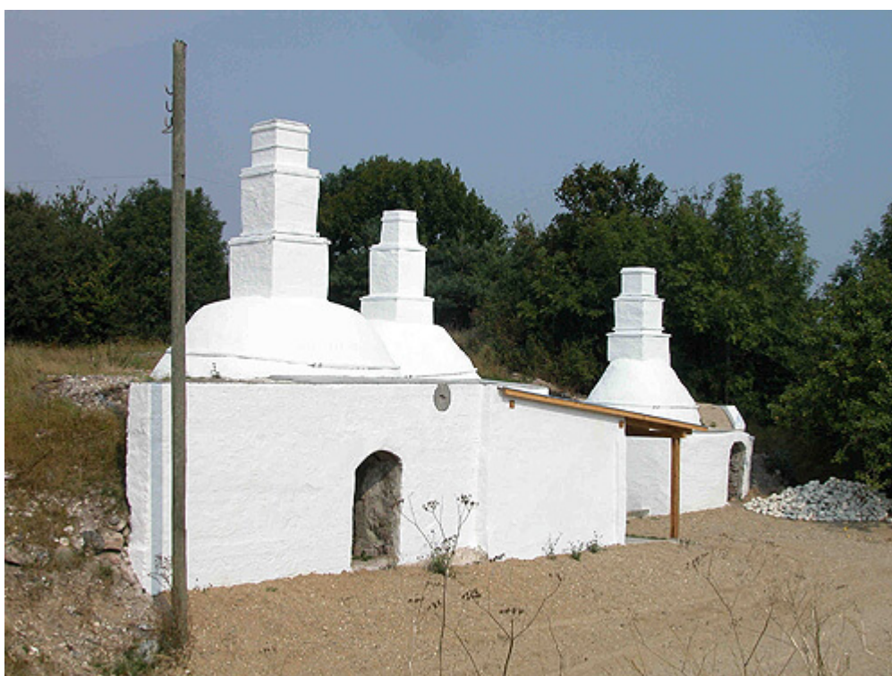
Birkesig kalkovnene efter endt restaurering år 2002.

I 2002 blev de tre ovne restaureret gennem et samarbejde mellem Ebeltoft Kommune og Århus Amt.