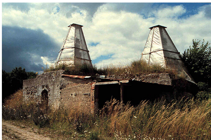
5: Birkesig kalkovnene før restaurering.