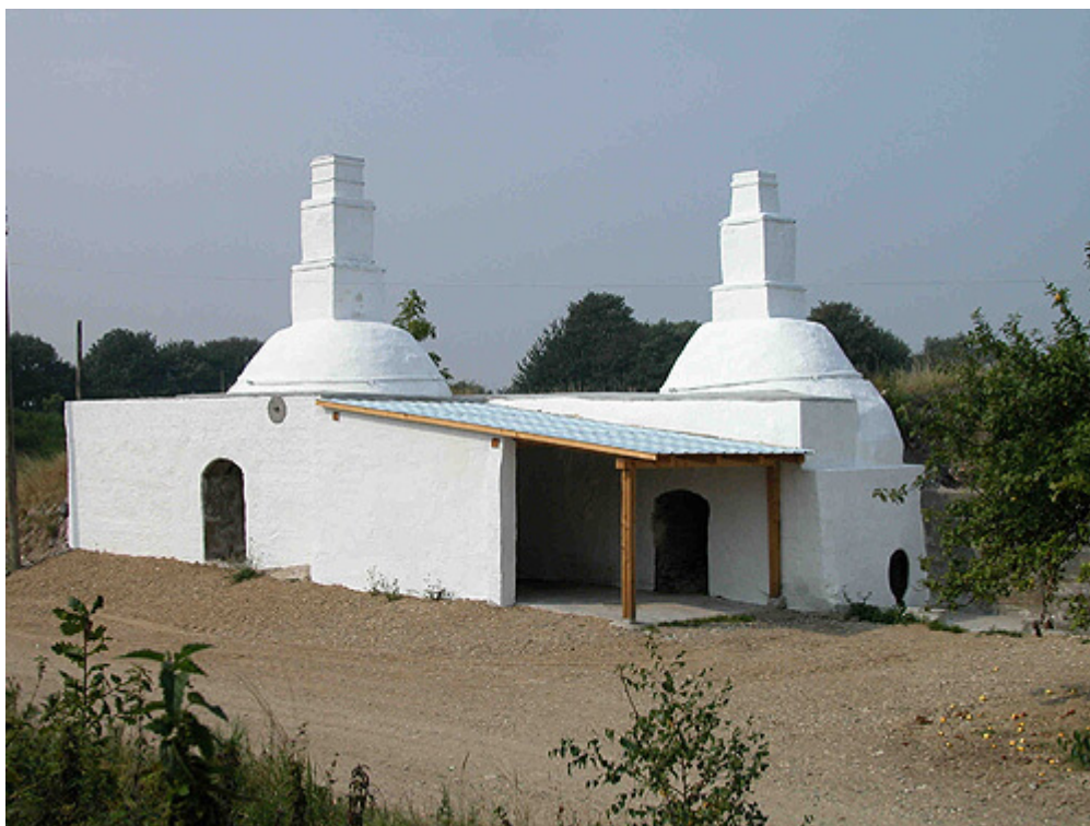
Kalkovnene ved Birkesig i 2002.

Brænding af kalksten med henblik på fremstilling af læsket kalk har spillet en stor rolle på Djursland i tiden fra o. 1840 til 1980, hvor det sidste store kalkværk på Djursland lukkede. Landskabet omkring Glatved syd for Grenå er stærkt omformet af de meget store kalk- og råstofgravninger, som har fundet sted gennem de seneste hundrede år, og kalkovnene ved Birkesig repræsenterer således den tidlige fase af denne industri.