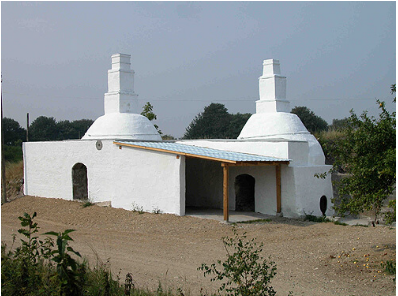
1: Kalkovnene ved Birkesig i 2002.