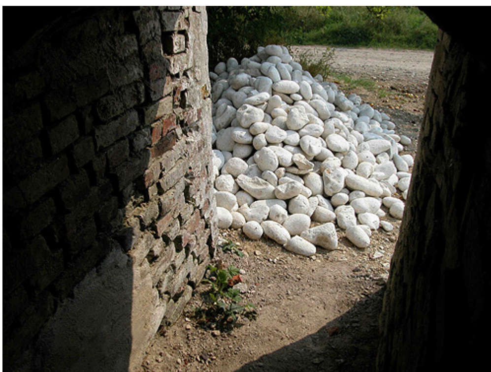
Et kig ud gennem indgangs- åbningen som blev tilmuret under brændingen.