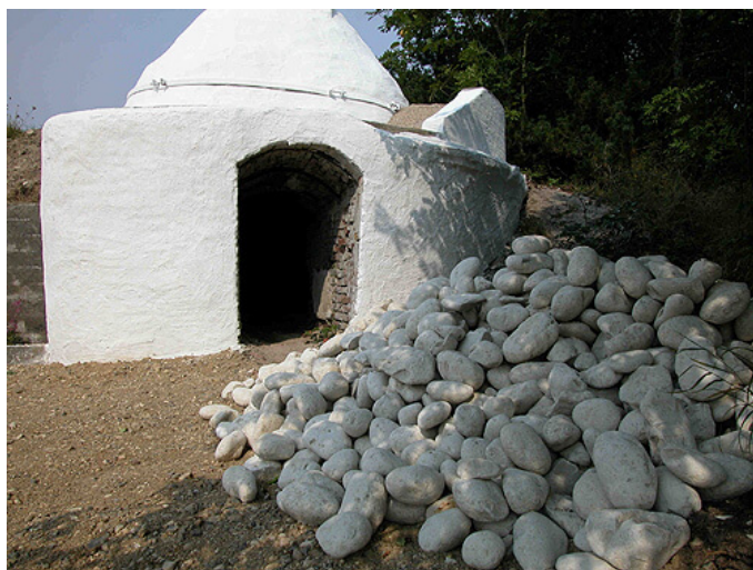
4: Opgravede kalkrullesten klar til brænding.